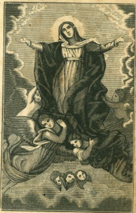
Uzneshénji B. D. Marie.